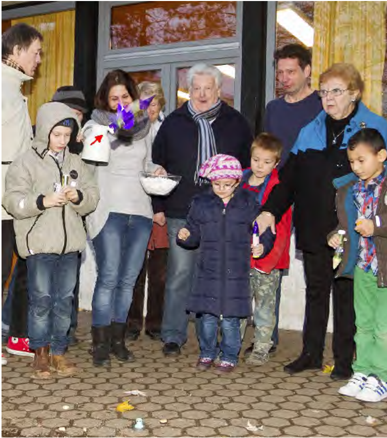
sie fliegt wirklich, siehe roter Pfeil